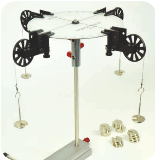
Különböző erők együttes hatása