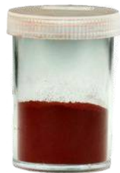
Száras púser, piros Rend. kód: P7050-1A