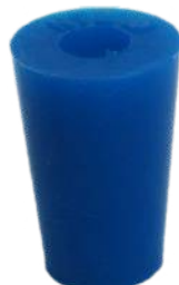
Szilikondugó 1 furattal, 12.4/18/27 mm Rend. kód: C7320-1D