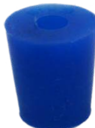
Szilikondugó 1 furattal, 17/22/25 mm, SB19 Rend. kód: C7320-2B