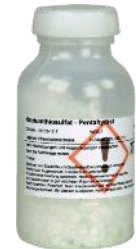
Szódium tioszulfát Rend. kód: P7020-4A