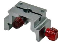
Csúszóelem érnő és mutató tartásához Rend. kód: P5310-3F