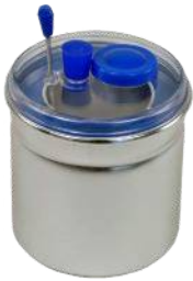
Hőntartó flaska tetővel Rend. kód: P2700-3D