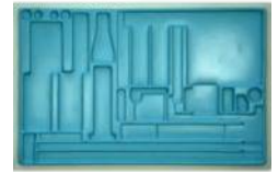
Doboz betét Rend. kód: P7906-4C