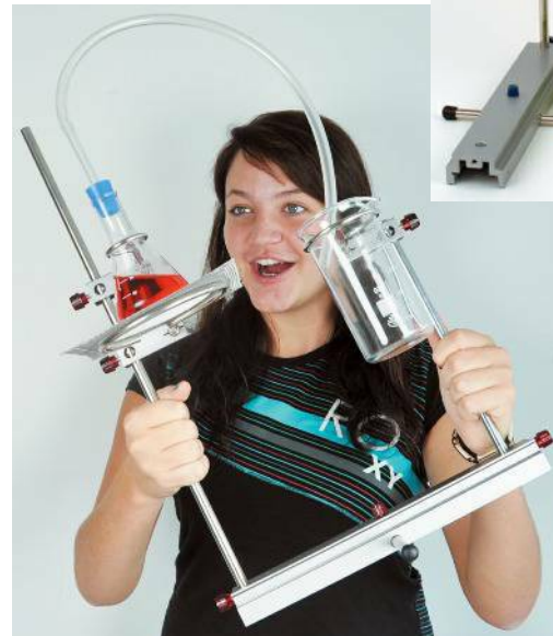
Az építő- és tartóelemek használata a Hőtan-1 készlettel