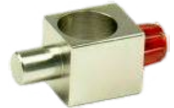
Tartóelem a dinamométerhez Rend. kód: P7230-4H