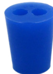
Szilikondugó 2 furattal, 17/22/25 mm, SB19 Rend. kód: C7320-2C