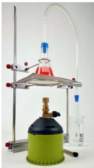
TDS 2.8. Desztilláció