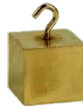
Vaskocka akasztóval, kicsi Rend. kód: P1120-3D