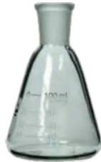
Erlenmeyer flaska, 100 ml, sb19 nyílás Rend. kód: C3020-4B